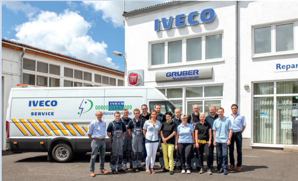
Unser Team in Dingelstädt

Dieser Standort kann ebenfalls auf eine lange Tradition als Kfz-Werkstatt zurückblicken. Schon seit 1975 erfolgten Reparaturleistungen für IVECO Magirus Fahrzeuge von Speditionen in der DDR. Mit der Neufirmierung der Autohaus Drei Linden GmbH im Jahr 1993 ist die Werkstatt in Dingelstädt spezialisiert auf Fahrzeugumbauten und Karosseriearbeiten sowie Unfallinstandsetzungen. Über die Autobahn A38 ist er gut erreichbar. Im Jahr 2018 wurde dieser Standort ein Filialbetrieb der GRUBER Nutzfahrzeuge GmbH.