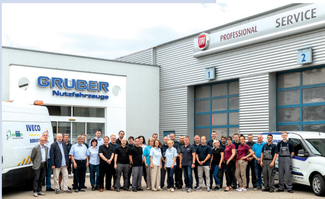
Unser Team in Leipzig

Unser Standort in Leipzig ist seit 1991 Stammsitz der GRUBER Nutzfahrzeuge GmbH. Zentral im Leipziger Norden gelegen ist er über die Autobahnen A14, A38 und A9 sehr gut erreichbar. Mit unseren langen Öffnungszeiten bieten wir einen kundenfreundlichen Service für Firmen und Selbstständige an. Unsere Mitarbeiter der Werkstatt werden ständig geschult und qualifiziert. Somit ist Ihr Fahrzeug bei uns in besten Händen.