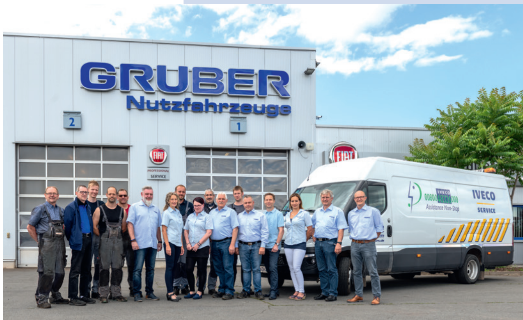
Unser Team in Nordhausen

Der Standort Nordhausen wurde als Autohaus errichtet und seit 2001 als Filialbetrieb der ehemaligen Autohaus Drei Linden GmbH geführt. Seit einer Werkstatteerweiterung im Jahr 2013 gibt es hier eine IVECO Truck Station. Durch die nahe Autobahnanbindung zur A38 ist er sehr schnell erreichbar. Im Jahr 2018 wurde dieser Standort ebenso ein Filialbetrieb der GRUBER Nutzfahrzeuge GmbH.