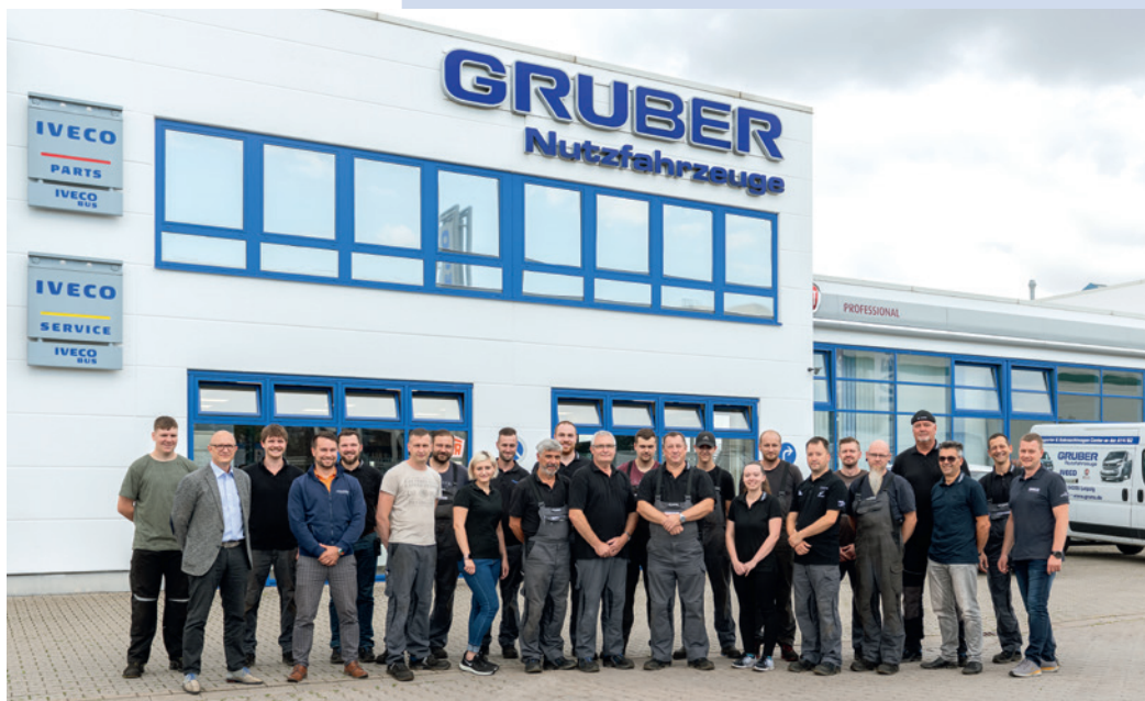
Unser Team in Queis

Aus dem ursprünglichen Standort am Spielrain 15 in Halle Büschdorf wurde der 1997 neu erbaute Standort im Gewerbegebiet Landsberg OT Queis in unmittelbarer Nähe zur A14 in Betrieb genommen. Bis heute ist dies einer der modernsten IVECO Betriebe Europas und seit 2011 Truck Station für IVECO mit OnStopService für Lkw und Auflieger.